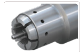
Orifices de purge

Le connecteur TW102 a des orifices de purge (voir figure ci-contre) dans le manchon. En cas d'une fuite de gaz involontaire, les orifices dérivent le gaz latéralement du clapet de la bouteille.